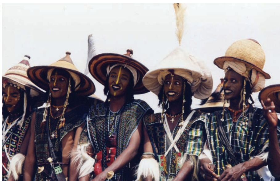
Figura 1: Yaake , linhagem Bii Korony'en. Abalak, Níger, 1996.

conta a dimensão estética e coreográfica das expressões do rosto na yaake . Pois estas não somente acompanham o movimento; elas fazem parte integrante da coreografia para os WoDaaBe . Usar um vocabulário coreográfico, com sua dimensão técnica, representa por isso um desafio considerável. Por um lado, ele pode participar no reconhecimento de um aspecto central nas concepções dos agentes e em uma descrição mais precisa do gesto realizado 7 . Por outro lado, ele pode ser etnocêntrico pela concepção do corpo e do movimento que implica, ou apresentar certos limites. O rosto, por exemplo, nem sempre foi incluído num glossário específico muito extenso no que diz respeito às danças europeias. Tudo isto manda o antropólogo da dança de volta às pré-estruturações de seu projeto. E a continuação da escrita da yaake permite aprofundar este ponto.